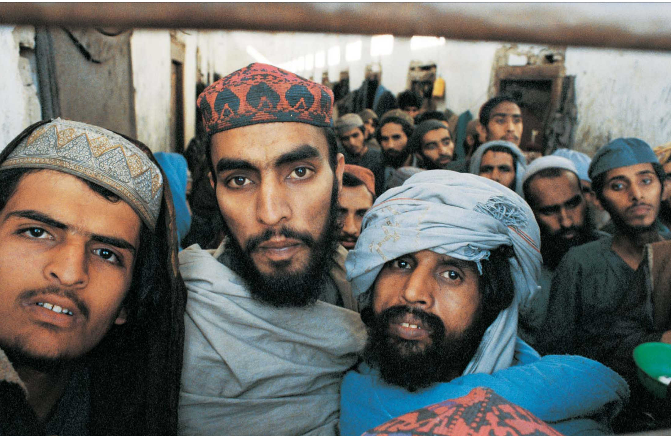
NETUŠÍ, ŽE ZAČALA VÁLKA. „Nemají právo vědět, co se děje kolem,“ řekli mi dozorcí. A tak tito muži netuší, že svět se změnil a americké letectvo nyní bombarduje Tálibán. Poblíž Chodža Bahaudín, 2001.