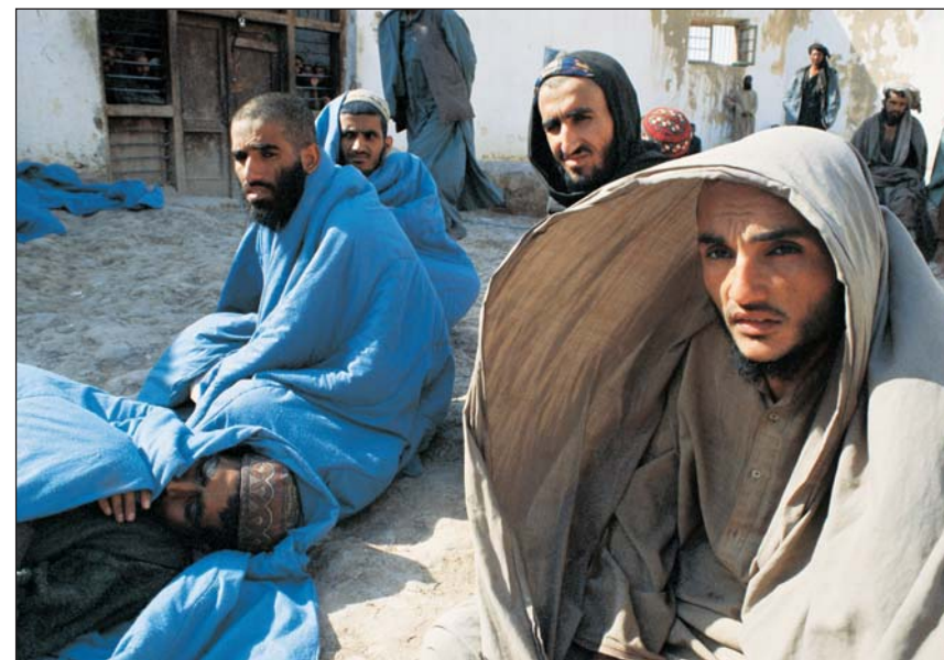
ŽIJÍ JEŠTĚ? Po konci války zřejmě většina ze zajatců dostala svobodu. Ne však všichni, právě na severu země byli zajatí tálibánci často masakrováni. Poblíž Chodža Bahaudín, 2001.

Afghánistán je zemí uprchlíků, miliony lidí, nejbídnější z bídných, živoří v táborech po celé zemi, od vyprahlých rovin po údolí nebetýchých horstev. Nikdo se již není schopen dopočítat, kolikrát se za čtvrt století války zvedly vlny zoufalých Afghánců. Nejprve lidé prchali před sovětskými bombardéry, pak před